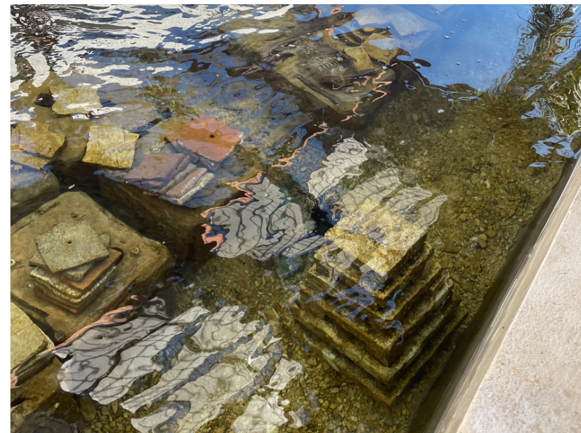
Structure récifale ARMS restore