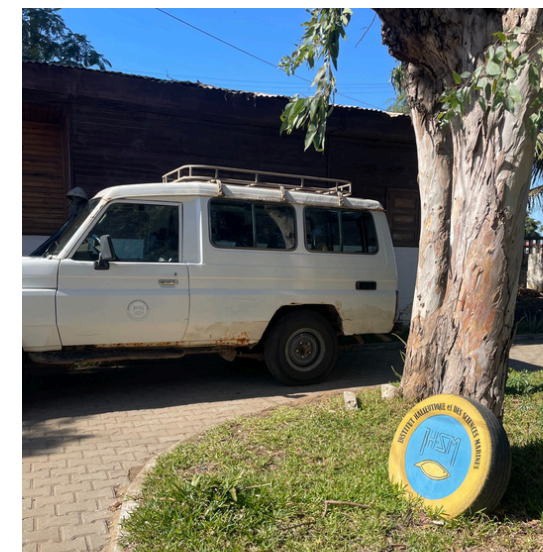
Institut Halieutique et des sciences marines