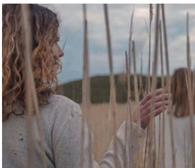
© Extrait - La Mélodie du silence