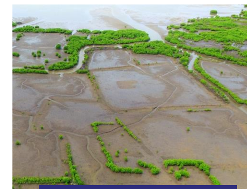
MANGROVES VUES DU CIEL