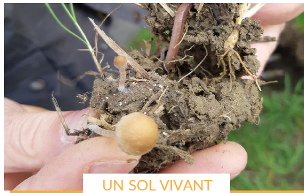
UN SOL VIVANT