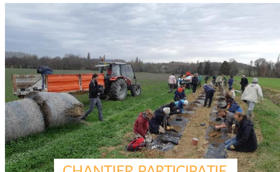
CHANTIER PARTICIPATIF DE PLANTATION