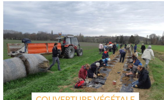
COUVERTURE VÉGÉTALE DES SOLS